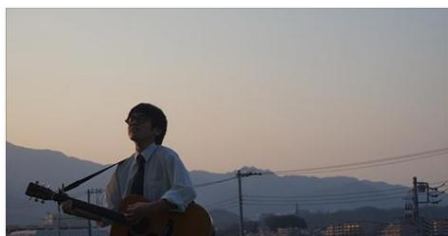
きのこ問屋渾身！きのこの歌とプロモーションビデオを作りました きのこの歌作りました！... KINOKONOJIKAN.COM

きのこ問屋バイオコスモで撮影した『きのこ汁の歌』PV のメイキングシーンなどをご紹介します。